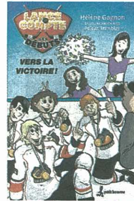
Lance et compte T.1 : Vers la victoire ! et T.2 : Trio d'enfer, Hélène Gagnon, en collaboration avec Réjean Tremblay, illustrations de Martin Roy. Les Éditions Petit Homme, 144 pages.