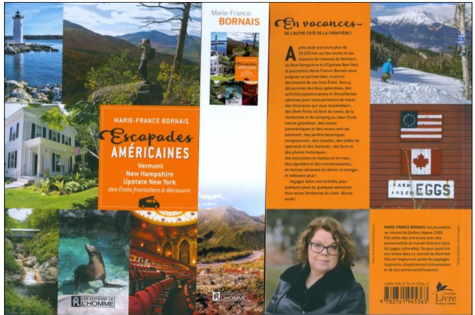
Escapades américaines, Vermont, New Hampshire, Upstate New York , Les Éditions de l'Homme, ISBN 978-2-7619-4536-3, 29,95 $.