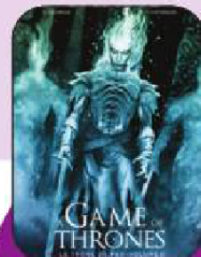
A Game of Thrones, Le trône de fer, Volume III Éditions Dargaud George R.R. Martin Tommy Patterson Daniel Abraham