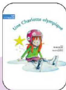
Une Charlotte olympique Les Éditions de la Bagnole Benoit Laverdière Mireille Messier