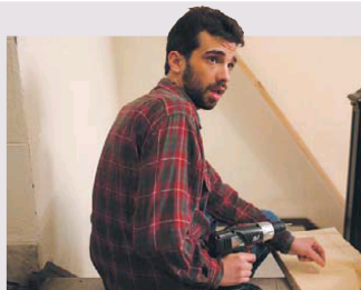
Chrystine Brouillet a reçu en 1982 le prix Robert-Cliche pour son premier roman, Chère voisine. Celui-ci a été adapté au grand écran par Jacob Tierney. Sur la photo, l'acteur Jay Baruchel. Trente ans plus tard, l'auteure publie la suite: Louise est de retour.