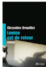
Chrystine Brouillet, Louise est de retour, Les Éditions de l'Homme, 232 pages.

Elle rencontrera les visiteurs du Salon international du livre de Québec.