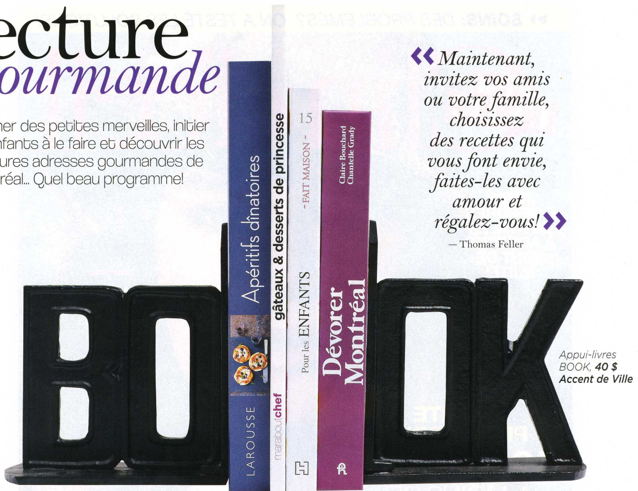
Appui-livres BOOK, 40 $ Accent de Ville