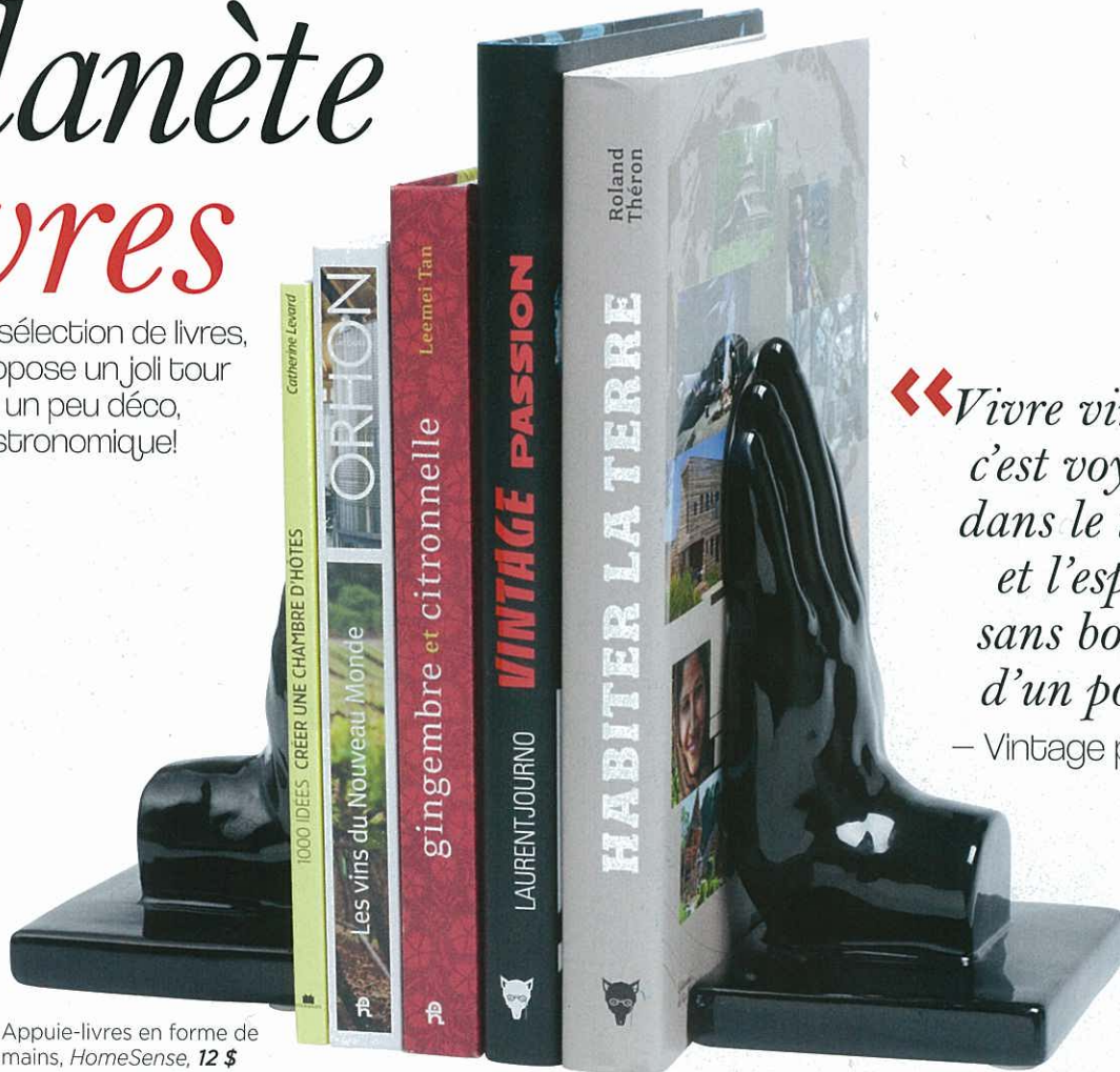
Appuie-livres en forme de mains, HomeSense, 12 $

Par cette sélection de livres, je vous propose un joli tour du monde, un peu déco, un peu gastronomique!